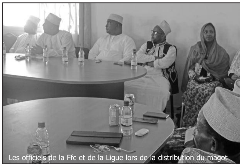
Les officiels de la Ffc et de la Ligue lors de la distribution du magot

Les vice-présidents insulaires explosent de joie, et remercient du fond du cœur le gros effort fourni