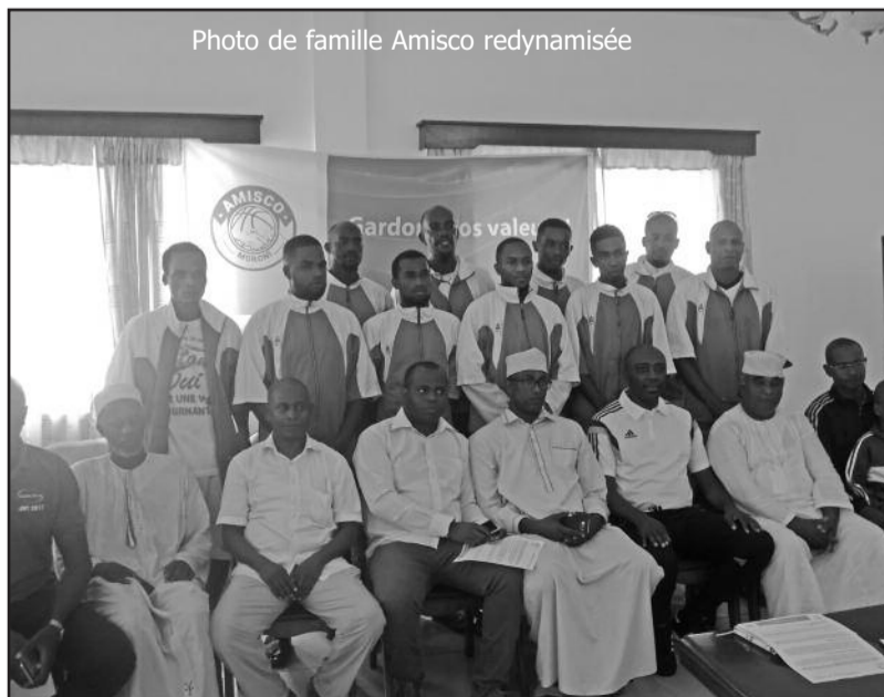
Photo de famille Amisco redynamisée